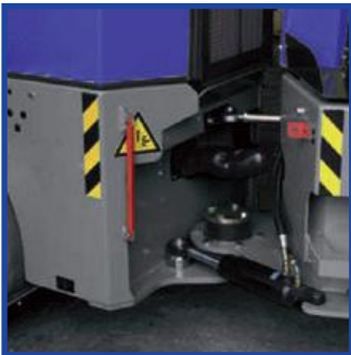
lebensdauer geschmiertes Teflon- Pendelgelenk